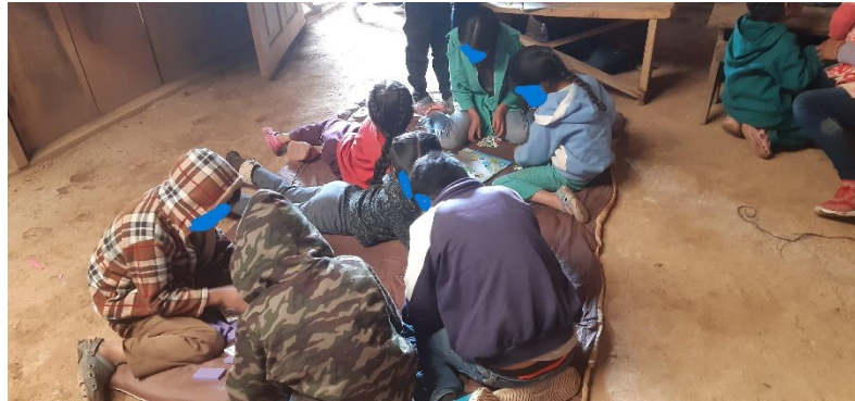
Niños armando rompecabezas

En la Figura 1 se puede destacar que los niños víctimas de DFI se encuentran armando rompecabezas como técnica lúdica para generar confianza.