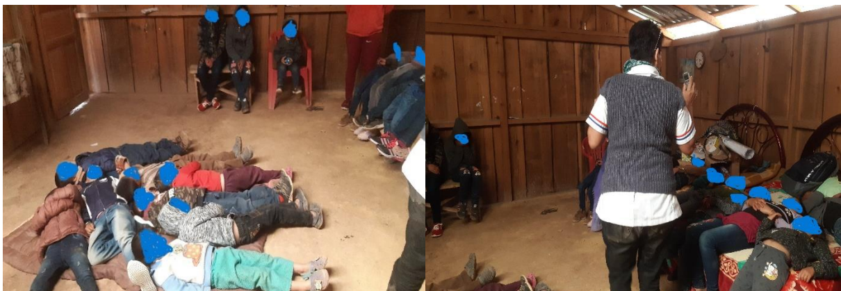
Niños víctimas de DFI en la visualización guiada